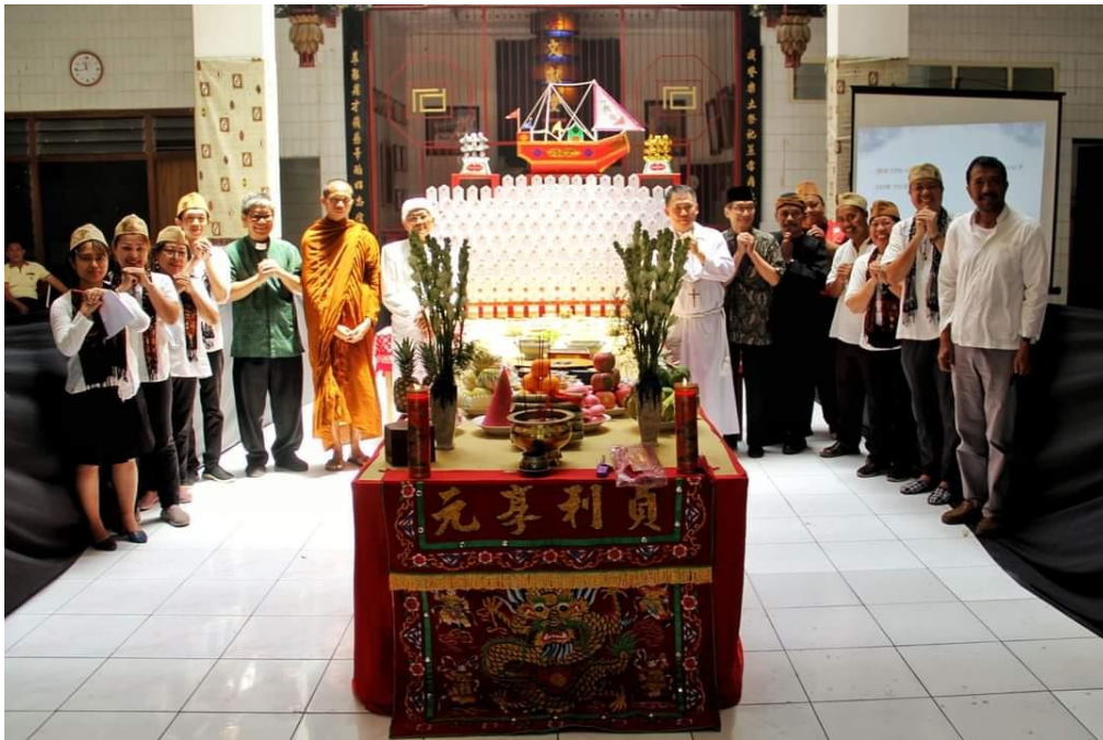
Gambar 3. Altar khusus yang dibuat untuk sembahyang King Hoo Ping di halaman gedung Boen Hian Tong atau Perkumpulan Rasa Dharma

Sembahyang King Hoo Ping merupakan ritual sembahyang penghormatan arwah yang dilakukan oleh umat Khonghucu pada setiap akhir bulan ketujuh penanggalan Kongzili yaitu bulan Jit Gwe. Umat Khonghucu percaya bahwa pada bulan Jit Gwe para arwah diberi kesempatan untuk turun ke dunia guna menengok para anak, cucu, dan sahabat. Sebagai salah satu upacara ritual yang sakral, umat Khonghucu melakukan sembahyang King Hoo Ping dengan tujuan untuk menghormati arwah para leluhur, sahabat, dan umat pada umumnya agar para arwah tersebut merasa tenang dan damai di alam keabadian. Guna melakukan ritual sembahyang Kong Hoo Ping tersebut maka umat Khonghucu akan membuat altar secara khusus yang diletakkan di halaman klenteng atau rumah abu (Matakin, 2015).