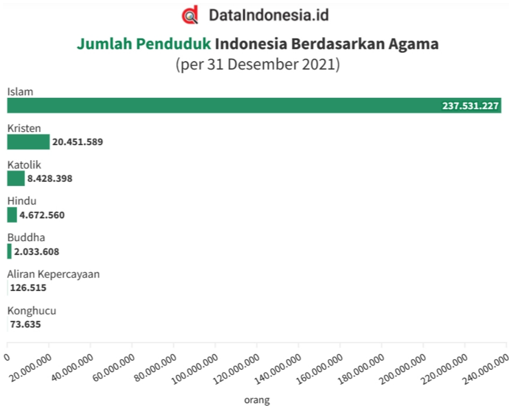
Gambar 1. Jumlah Penduduk Indonesia Berdasarkan Agama (per 31 Desember 2021)

Secara statistik jumlah penganut agama Khonghucu di Indonesia per Bulan Desember 2021 adalah sebesar 0,03% dari total populasi atau sejumlah 73.635 jiwa. Berikut adalah gambar jumlah statistik pemeluk agama di Indonesia berdasarkan data dari Kementerian Dalam Negeri yang disarikan oleh DataIndonesia.id: