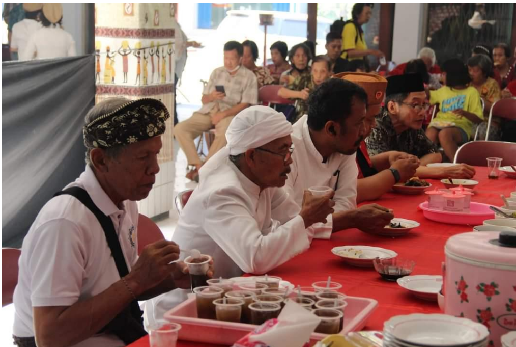
Gambar 7. Para pemuka agama sedang makan bersama di meja makan pada akhir prosesi sembahyang King Hoo Ping lintas agama

Perjumpaan skriptural dalam konteks ritual dilakukan dengan pembacaan doa-doa lintas agama secara bergiliran, sedangkan perjumpaan dan komunikasi secara langsung dilakukan pada saat sebelum dan sesudah ritual sembahyang berlangsung. Segera setelah ritual utama dalam sembahyang King Hoo Ping selesai dilakukan, maka rangkaian ritual ditutup dengan makan bersama. Dalam tradisi filosofi Khonghucu, makan bersama mendapatkan tempat yang penting di mana bagi para penganut agama Tiongkok kuno itu makan dan teman adalah dua hal yang tak dapat dipisahkan dalam hidup. Oleh karenanya praktik makan bersama setelah ritual utama selesai juga dapat dimaknai secara ritualistik. Makan bersama bukanlah tindakan yang bersifat privat dan sekularistik, lepas dari makna-makna filosofi dan teologis. Makan bersama justru merupakan tindakan yang dapat memperkuat persatuan dan loyalitas komunal, dan oleh karenanya ia juga merupakan tindakan yang memiliki makna ritual dan kesalehan sosial. Di meja makan lah, orang-orang akan bertukar cerita, ide, gagasan, dan bahkan pandangan keagamaan. Maka makan bersama sebagai bagian dari ritual sembahyang King Hoo Ping lintas agama mendapatkan legitimasinya sebagai jembatan komunikasi bagi orang-orang yang berbeda agama dan kepercayaan yang hadir di kegiatan interritual tersebut.