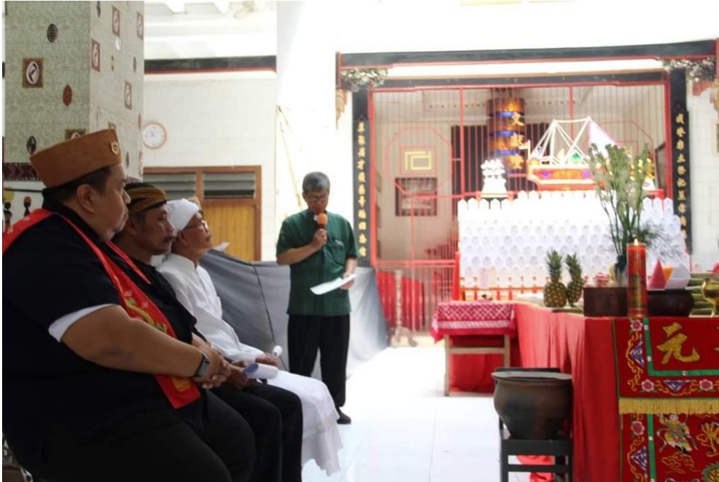
Gambar 6. Pemuka agama Kristen sedang melantunkan doa bagi para arwah di depan para pemuka agama dan kepercayaan yang turut hadir. Nampak dalam gambar para pemuka agama Khonghucu, Hindu, dan pemuka Penghayat Kepercayaan terhadap Tuhan Yang maha Esa

Ketika umat Khonghucu dengan sadar mengundang pemuka agama dan kepercayaan lain untuk berpartisipasi dalam ritual privat mereka, maka sebetulnya umat Khonghucu telah membuka lebar pintu ‘rumah keagamaan’ mereka bagi orang asing dan orang luar yang datang membawa tradisi dan pengetahuan teologis yang berbeda. Hospitality yang ditawarkan oleh umat Khonghucu menjadi semakin kentara ketika mereka mempersilahkan para pemuka agama dan kepercayaan untuk berdoa menurut tradisi keagamaan mereka masing-masing, dengan ungkapan dan pilihan kata khas agama dan kepercayaan masing-masing. Melalui praktik hospitality semacam ini, umat Khonghucu telah mengubah orang asing dan orang luar menjadi tamu di dalam ‘rumah keagamaan’ mereka. Menurut Andi Gunawan keterbukaan umat Khonghucu untuk menerima umat agama lain di ritual keagamaan mereka dilandasi oleh semangat fleksibilitas yang memang ada dalam filosofi dan teologi agama Khonghucu. Fleksibilitas yang dimaksud adalah umat Khonghucu dapat bertindak di ruang-antara teologis dengan tetap menjaga keseimbangan seturut filosofi Yin dan Yang (A. Gunawan, komunikasi personal, 20 September, 2023). Dengan tetap menjaga keseimbangan antara baik-buruk, lebih-kurang, umat Khonghucu memiliki kedewasaan dan kemandirian berpikir dalam menawarkan tindakan-tindakan hospitality , termasuk mengundang umat agama dan kepercayaan lain untuk terlibat dalam ritual internal mereka.