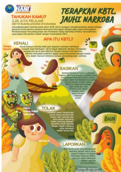
Gambar 3. Poster Terapkan KBTL Jauhi Narkotika

Warna di dalam poster ini didominasi dengan warna kuning terang yang diharmonisasikan dengan warna oranye muda digunakan sebagai warna latar belakang pada poster. Sementara Pada bagian ilustrasi terdapat gradasi warna hijau kekuningan, gradasi coklat, gradasi oranye dan warna cream sebagai skintone, serta warna hijau kebiruan pada bagian tengah sampai